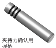
夹持力确认用握柄